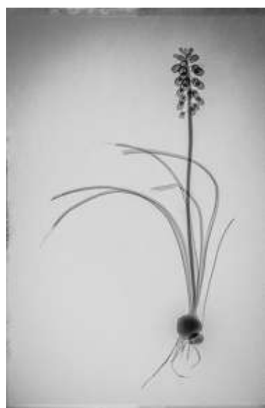
Muhanad Baas , Botanix