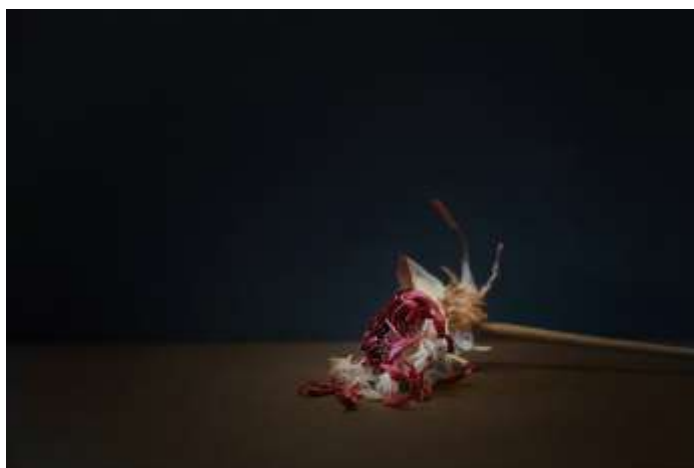
Bénédicte HANOT , Nature vivante